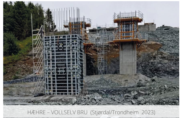
H/EHRE - VOLLSELV BRU (Stjørdal/Trondheim 2023)

Dette er kun eksempel: Utstyrslisten kan tilpasses behov